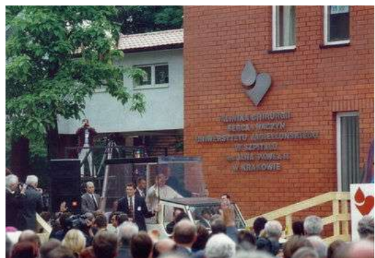
Wizyta św. Ojciec Jan Paweł II. w Krakowie 9 czerwca 1997 r. i poświęcenie kliniki