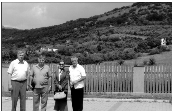
• Navrhované miesto umiestnenia pamätníka.

čl. politických väzňov, ktorého súčasťou je aj vyše 800-členná Sekcia násilne odvedených. Napriek tomuto neústretnému kroku voči obetiam stalinizmu organizácia bude podporovať realizáciu centrálného pamätníka násilne odvedeným v maximálnej možnej miere a z tohto dôvodu sa obracia na všetkých našich členov a priaznivcov na celom svete, aby sa v rámci svojich možností pričínili, aby aj tisíce obetí stalinských represíí mali na Slovensku svoj dôstojný pamätník. Za každý príspevok a dar vyslovujem v mene týchto obetí úprimné poďakovanie.